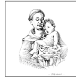
S. Antonio da Padova Waiblingen